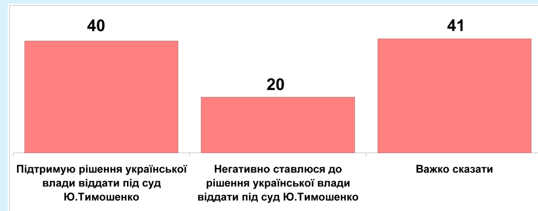
Графік 2. Яка з точок зору з приводу суду над Юлею Тимошенко вам є ближчою? (населення Росії) (% від усіх опитаних)