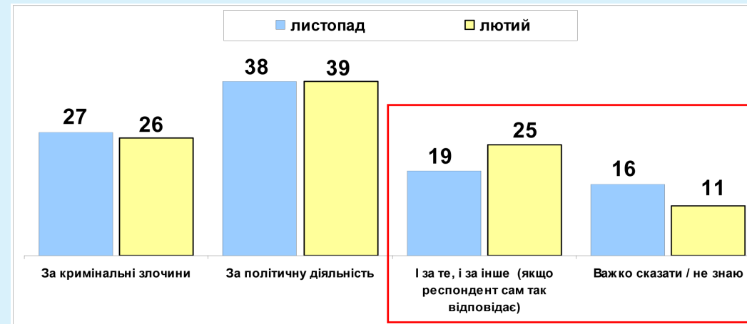
Графік 1. Як Ви вважаєте, Юлія Тимошенко опинилась у тюрмі за кримінальні злочини чи за політичну діяльність? (населення України) (% дорослого населення від 18 років і старших)