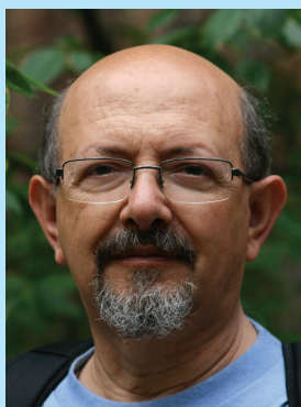
Володимир Паніотто генеральний директор КМІС