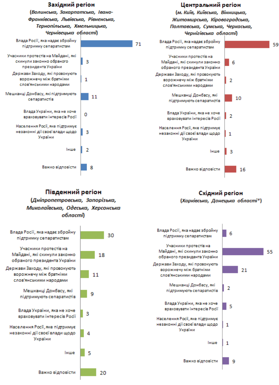
Графік 2. Розподіл відповідей на запитання «Хто, на Вашу думку, насамперед винен у нинішньому кровопролитті на Донбасі?» за макрорегіонами, %